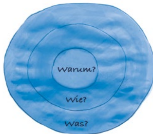
The „golden circle“ from Simon Sinek

Simon Sinek führt aus, dass durch die Motivation aus dem inneren Kreis Inspiration entsteht. Inspirierte Unternehmen zeigen offensiv, woran sie glauben und warum sie tun, was sie tun. Sie realisieren einen inneren Zweck, haben klare Werte und geben ihrem unternehmerischen Wirken einen expliziten Sinn. Das ist es, was sie motiviert, tagtäglich Großartiges zu leisten. Durch diese Schaffenskraft mit Herz und Seele werden die Gefühle der Menschen angesprochen – die der Mitarbeiter, die der Kunden. Während herkömmliche Unternehmen großartige Produkte produzieren können, mit perfektem Styling und coolen Gadgets, verkaufen die anderen ein Lebensgefühl. Durch das Warum entsteht der Sinn des Handelns, daraus ergeben sich das Was und das Wie. Damit beeinflusst die Definition des Warums übrigens auch maßgeblich die Rekrutierung neuer Mitarbeiter. Intrinsisch – also durch einen Sinn – motivierte Mitarbeiter sind in den heutigen komplexen Zeiten besonders wichtig. Durch ihr eigenverantwortliches Handeln helfen sie Organisationen dabei, mit komplexen Problemen umzugehen.